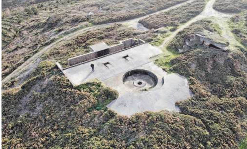
El grupo de Prior será el primero que se recupere dentro del plan del ente provincial. CÉSAR TOIMIL

«Vamos a reservar fondos para la redacción de proyectos de recuperación de las baterías. Y nos gustaría disponer este año al menos del de Prior», anota la responsable municipal, quien explica que el documento marcará las líneas a seguir para recuperar las infraestructuras militares, que ocupan lugares estratégicos del litoral y se encuentran en estado ruinoso y atestadas de maleza. Con todo, antes de empre-