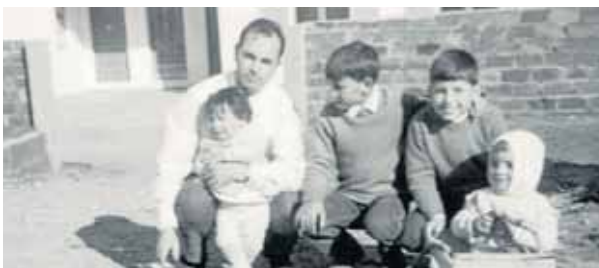
Na eira e casa en construción